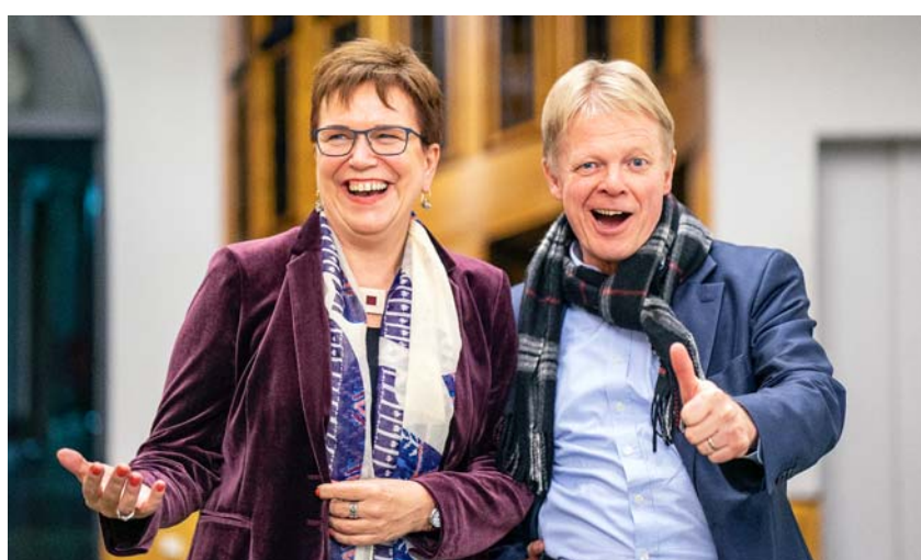
Schulterschluss: Berlins SPD-Europakandidatin Gaby Bischoff und der DGB-Vorsitzende Reiner Hoffmann kämpfen für einen europäischen Mindestlohn.