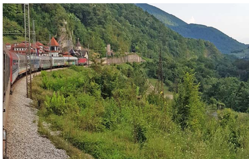
Im Zug kann man Europa und seine Menschen besonders entspannt kennenlernen.

Doch der längere Aufenthalt im Ausland – ob zum Schüleraustausch, zum Studieren, Arbeiten oder Sprachenlernen – bleibt die Ausnahme. Laut einem Bildungsvorlag haben im vergangenen Schuljahr 0,5 % der Oberschüler und Gymnasiasten an einem Schulaustausch im Ausland teilgenommen.