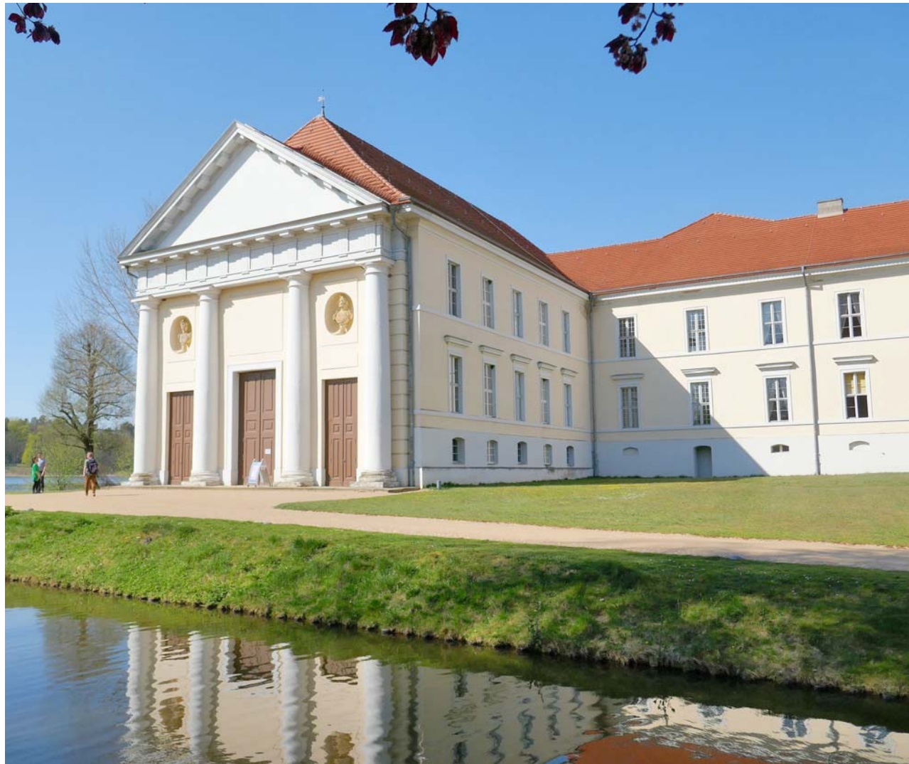
Rheinsberg: In die Sanierung des Schlosses flossen auch europäische Fördermittel.

Zum Beispiel in Rathenow mit seinem Optikindustriemuseum, das an die Anfänge der optischen Industrie erinnert. Mit EU-Mitteln wurde der Radweg entlang der Havel angelegt. In Stölln bei Rathenow erinnert