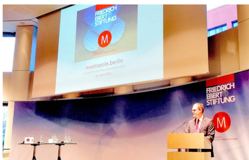
Michael Müller rief bei der „medropole.berlin“ dazu auf, die Chancen der Digitalisierung für die Gesundheitswirtschaft zu nutzen.

Die Teilnehmer der Veranstaltung warnten aber auch, Trends nicht zu verschlafen: Investitionen, etwa in neue Geräte, sollten erhöht und eine strukturierte Zusammenarbeit zwischen der Charité in der Hochleistungsmedizin und Vivantes in der Versorgungsmedizin umgesetzt werden.