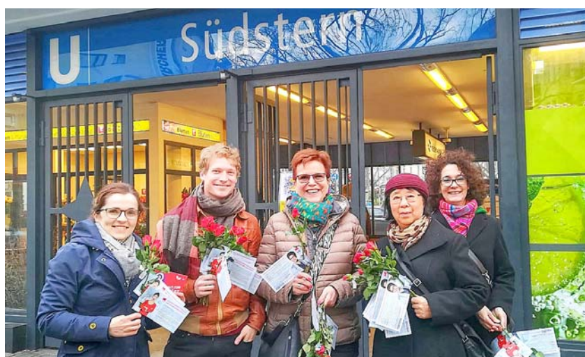
Unterwegs in Berlin: Gaby Bischoff bekommt viel Unterstützung für ihren Traum von einem Europa der Freiheit, der Teilhabe und der sozialen Gerechtigkeit. Hier von der SPD Südstern.