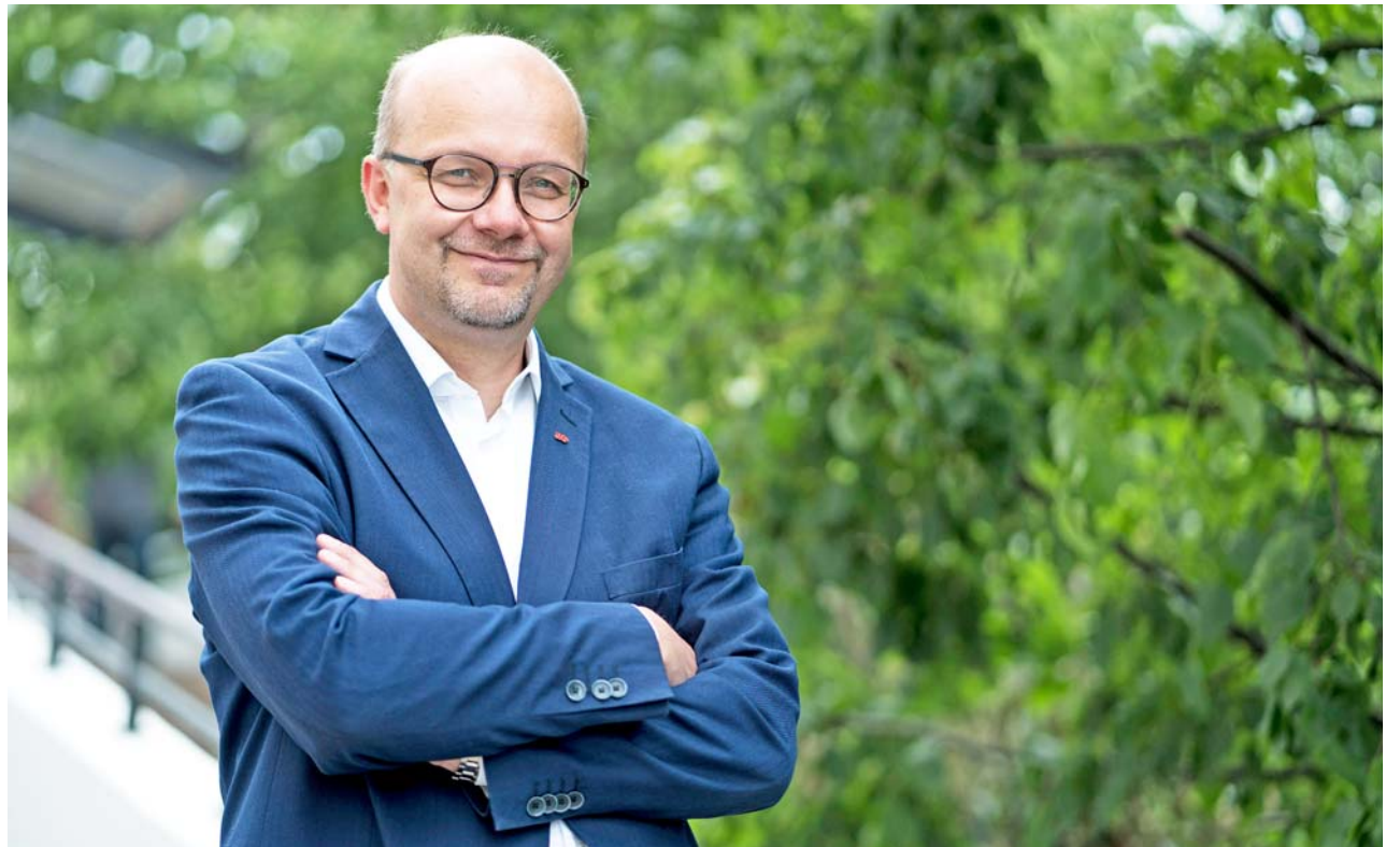
Fritz Felgentreu, MdB, ist verteidigungspolitischer Sprecher der SPD-Bundestagsfraktion.

Dabei wurden die Vorläufer der EU nach dem Schrecken zweier Weltkriege in Europa zur Sicherung des Friedens gegründet. Wenn die europäischen Staaten wirtschaftlich zusammenarbeiten, so die Idee, haben sie weniger Interesse daran, gegeneinander Krieg zu führen. Von Anfang an kämpften die Sozialdemokraten in Deutschland für diese historisch einzigartige Gemeinschaft in Europa. Frieden, Wohlstand, soziale Gerechtigkeit – die SPD setzt sich heute wie damals für ein starkes, vereintes Europa ein.